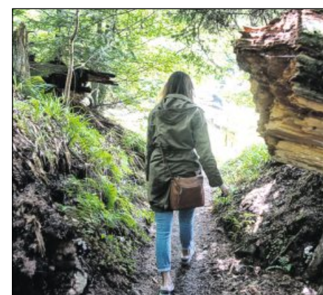
AUF DEM WILDNISPFAD kann man am Sonntag, 3. Juni , von 10 bis 13 Uhr bei einer Wanderung urwüchsige Natur sehen. Unter www.nationalpark-schwarzwald.de bitte anmelden.

Das dokKa-Festival in der Karlsruher Kinemathek präsentiert Dokumentarfilme, Hördokumentationen und Installationen. Vom morgigen Donnerstag, 31. Mai (Fronleichnam) bis Sonntag, 3. Juni , gibt es ein umfangreiches Programm. Infos: www.dokka.de . wid