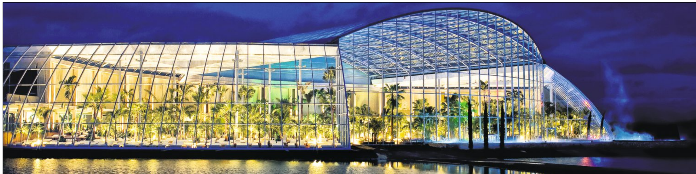
PALMEN-UTOPIA: Einen Kurzurlaub in der Südsee simuliert das Palmenparadies Sinsheim, das mit einem Cabrio-Dach kurzerhand zum Freibad umfunktioniert werden kann.