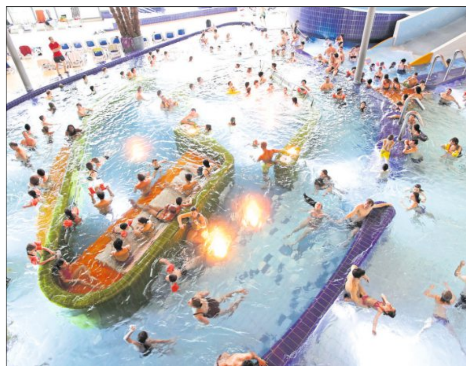
DAS STRÖMUNGSBECKEN ist nur eine der vielen Attraktionen des Karlsruher Europabads.

Eine Wellenbrandung wie am Meer verspricht das La Ola-Freibad in