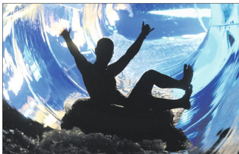
AB GEHT DIE POST: Rasante Rutschen bieten die Spaß- und Erlebnisbäder der Region. Das Foto zeigt die Reifenrutsche im Karlsruher Europabad.

Ganz frisch renoviert geht das Aquadrom Hockenheim ins Rennen um die Gunst der Badegäste. Ein neu gestalteter Kleinkinderbereich, eine 72 Meter lange Riesenrutsche mit mehreren Richtungswechseln und Lichteffekten sowie diverse Spaß- und Relaxbecken gehören zu den Attraktionen des etablierten Erlebnisbads. Besonders interessant ist allerdings der Außenbereich – denn das Aquadrom bietet unter anderem das größte Außenwellenbecken Deutschlands. Infos: www.aquadrom.de .